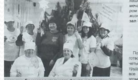
Опекунки Благотворительного фонда и волонтеры проводят Новогодний праздник

Многие граждане выражают свою благодарность за оказанную помощь. Это свидетельствует о том, что проект «Помощь рядом» действительно помогает людям.