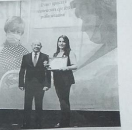
Вручение награды конкурса «Общественное признание»

ВОЛОНТЕРЫ СПЕШАТ НА ПОМОЩЬ... Каждому человеку нужна помощь, особенно если он имеет инвалидность или является пожилым гражданином. Волонтеры фонда готовы прийти на помощь в любой момент.